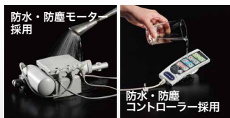
防水・防塵モーター採用

防水・防塵機能。水などがこぼれても安全にご使用頂けます。さらに、コントローラーは手元に高圧電流が流れない構造で安心。