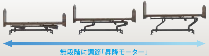
無段階に調節「昇降モーター」